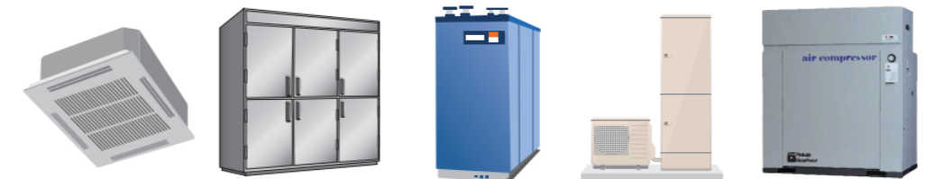
空調設備を省エネ型に更新